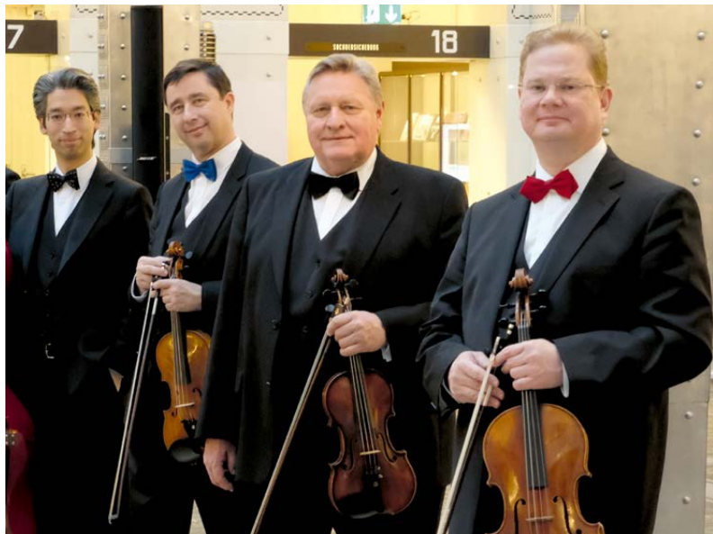
Thomas Christian Ensemble